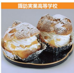
諏訪実業高等学校 諏訪の豊麗シュークリーム 1個 300円 (税込み)