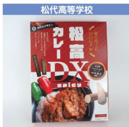
松代高等学校 松高カレーDX spicy 1個 600円 (税込み)