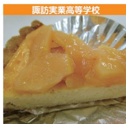
諏訪実業高等学校 甘酒チーズケーキ かりんのせ 1個 250円 (税込み)