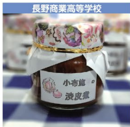
長野商業高等学校 小布施栗の渋皮煮 1個 1,600円 (税込み)