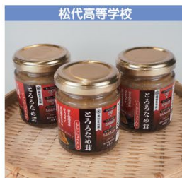
松代高等学校 とろろなめ茸 1個 450円 (税込み)