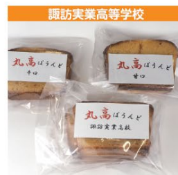
諏訪実業高等学校 丸高パウンド(甘口・辛口) 1個 150円 (税込み)