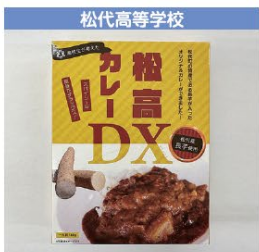
松代高等学校 松高カレーDX 1個 600円 (税込み)