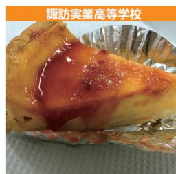
諏訪実業高等学校 甘酒チーズケーキ ルバージュ 1個 250円 (税込み)