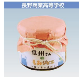
長野商業高等学校 信州さんのもみジビエ 1個 680円 (税込み)