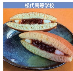
松代高等学校 杏ちゃんwithチーズ 1個 270円 (税込み)