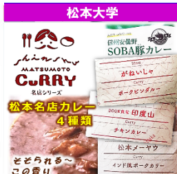
松本大学 松本名店カレー ゆにっと 特別価格 各 600円 (税込み)