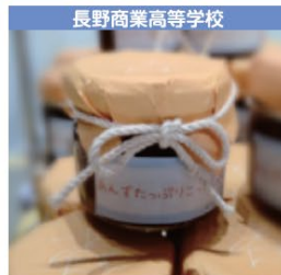
長野商業高等学校 あんずたっぷりこつとじゃむ 1個 380円 (税込み)