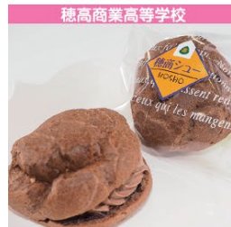
穂高商業高等学校 ダブルチョコ穂商シュー 1個 300円 (税込み)