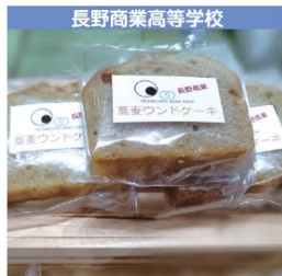
長野商業高等学校 蕎麦ウンドケーキ 1個 170円 (税込み)