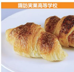
諏訪実業高等学校 かりんのクロワッサン 1個 150円 (税込み)