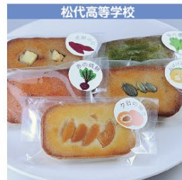
松代高等学校 フィナンシェ 1個 240円 (税込み) 1セット6種類 1,400円 (税込み)