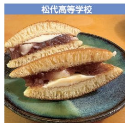
松代高等学校 松どら～そのまんま長いも～ 1個 290円 (税込み)