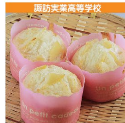
諏訪実業高等学校 花梨蒸しパン 1個 120円 (税込み)