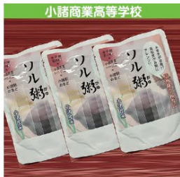
小諸商業高等学校 ソル粥(セット) 1個 1,000円 (税込み)