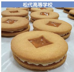
松代高等学校 松高銭クッキー 230円 (税込み) ～六文銭セット～ 1,300円 (税込み)