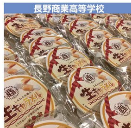
長野商業高等学校 生キャラメル 1個 380円 (税込み)