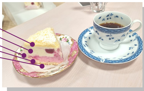
五重奏(層)ピンクのチーズケーキ