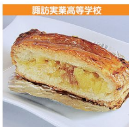
諏訪実業高等学校 スイートポテト風カリンパイ 1個 300円 (税込み)