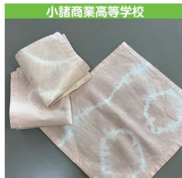
小諸商業高等学校 ソルガム染めバンダナ 1個 500円 (税込み)