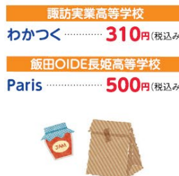
諏訪実業高等学校 わかつく …… 310円 (税込み) 飯田OIDE長姫高等学校 Paris …… 500円 (税込み)