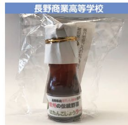
長野商業高等学校 ぼたんしょうらー油 1個 540円 (税込み)