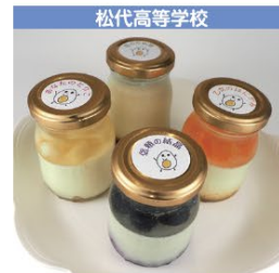
松代高等学校 プリン 1個 450円 (税込み)