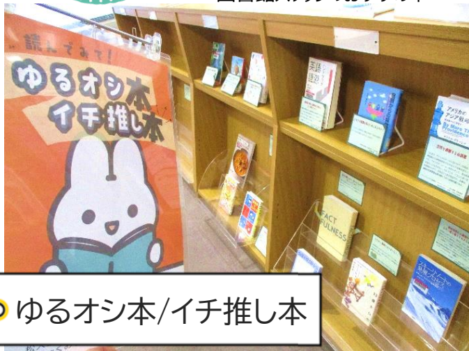
ゆるオシ本/イチ推し本