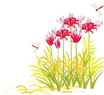
9月(長月) 秋涼 白露

今年の夏の日本は酷暑、豪雨、猛烈台風、大地震と自然災害に見舞われ、その脅威を感じずにはいられない夏でした。日本全国どこで災害が起こるかわかりません。備えが必要ですね。被災地の一日も早い復興を祈るばかりです。