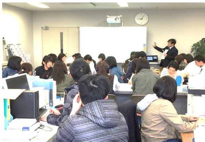
今年4月の朝の学習講座の様子