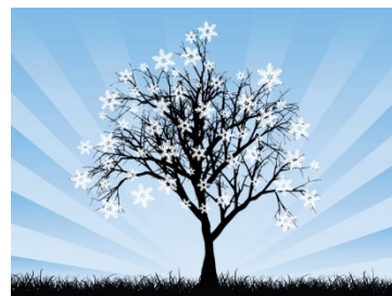
1月(睦月) 初春 厳寒 大寒