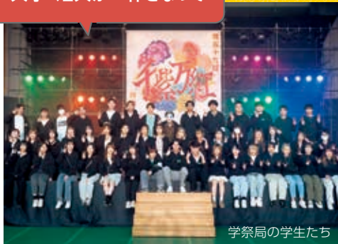
学祭局の学生たち