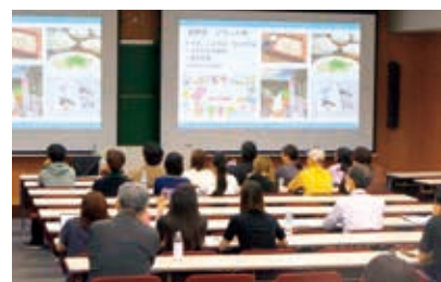
成果発表の様子から

来年度は、札幌大学での開催となります。引き続き本学も積極的に参加していく所存です。そして、この度の交流会でお世話になりました、関係機関の皆さま、あらためて心より感謝申し上げます。