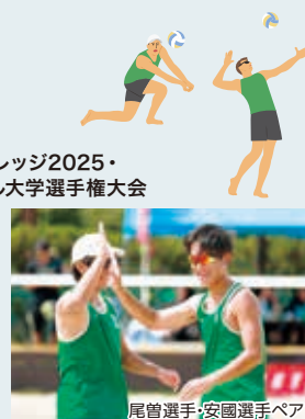
尾曾選手・安國選手ペア