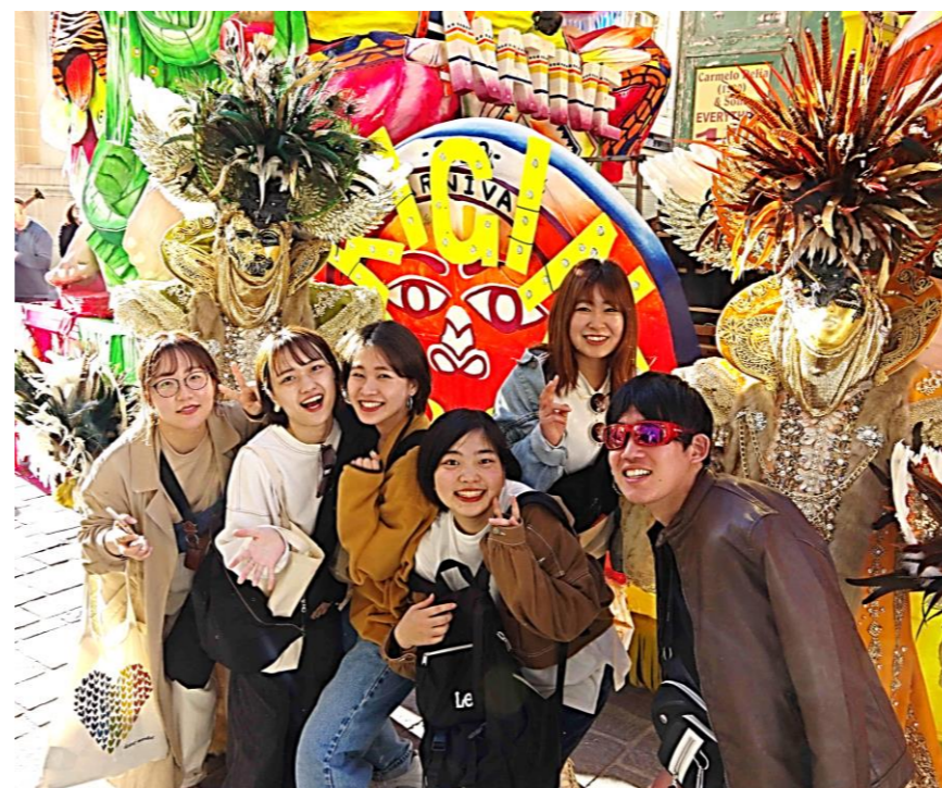
マルタ共和国 短期留学(約1ヶ月)