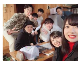
分厚いテキストを読破し親睦を深めたゼミ合宿(1月 大町にて)

類は友を呼ぶ? 個性豊かな学生たちと教員とが織りなす、その時々思いがけない化学反応がこのゼミの魅力なのかもしれません。