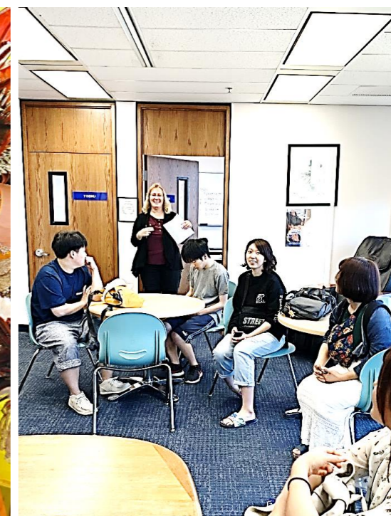
ハワイ州 異文化研修(2週間)

2月から3月にかけて、2か国において教育学部独自の留学プログラムを実施しました。学生は、各々にホームステイをしながら、マルタ大学ランゲージスクール、ハワイ ICC大学ランゲージスクールでの語学研修や、各国の学生や現地の方々との交流をとおして、身をもって異文化を体験してきました。