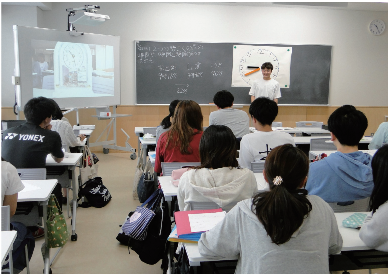
初等算数科指導法(2年生)の模擬授業風景

「地域と共に創る教育の未来」をビジョンに掲げてスタートした松本大学教育学部は、開設2年目を迎えました。人を育てるために必要な豊かな人間性や現場で即戦力となる力を身につけるため、地域の学校等での体験型授業を多く取り入れ、学生が知識を活用しながら自ら学ぶ環境づくりを行っています。2018年度より「教育学部タイムズ」(年4回)を発行し、学生の学びの姿や教育学部の授業・活動の様子を紹介して参ります。